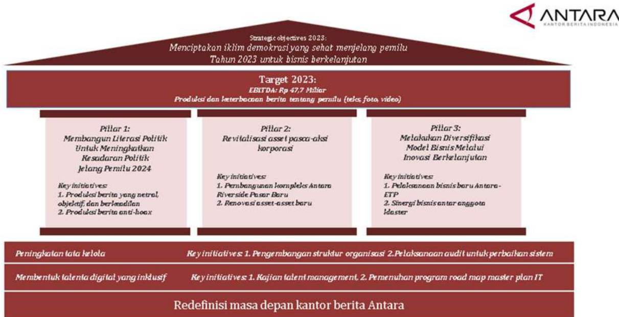
Gambar 3 Strategi Perum LKBN Antara tahun 2023

Berdasarkan sasaran-sasaran usaha di atas, Perum LKBN Antara menetapkan strategi perusahaan sebagai berikut;